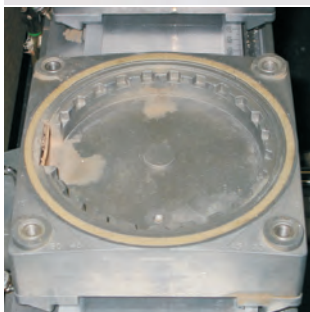
Einsetzbar bei diesen Saugeraufnahmen