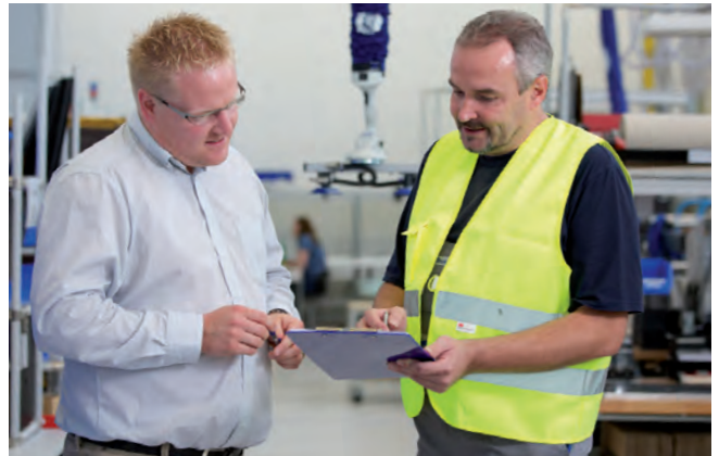
Jährliche UVV-Prüfung durch Schmalz Service-Techniker